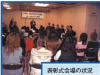
表彰式会場の状況