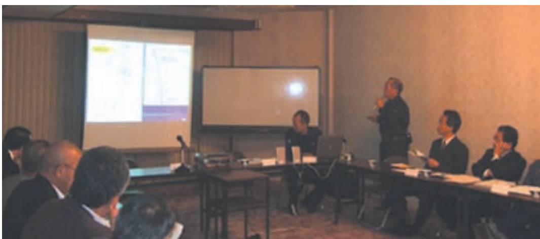
宮城危機管理監より災害予測説明